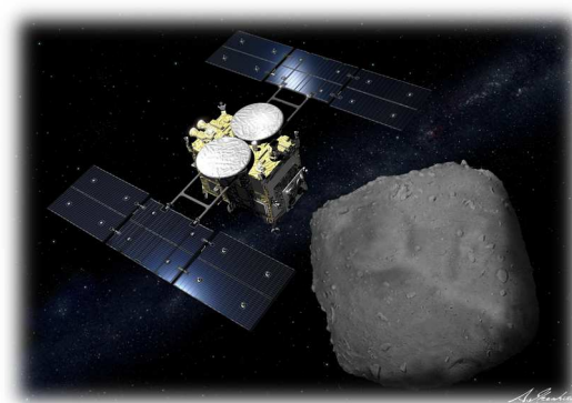
小惑星探査機「はやぶさ2」